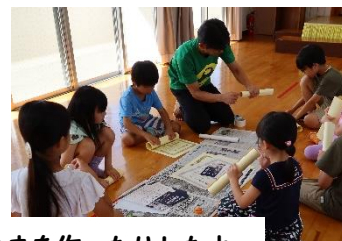
タワー、吹き矢、こまを作ったりしたよ。