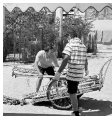
炎天下の中、頑張りました！